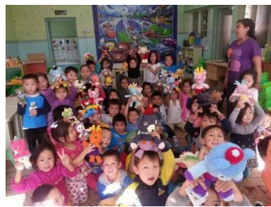
モンゴルの小学校へ寄贈された「笑顔の親善大使」