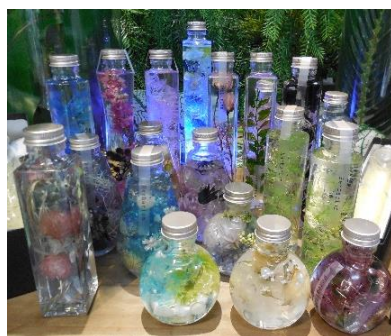
ハーバリウムのワークショップ「アンナサッカ」

これまでも花を使ったハンドメイドは人気がありましたが、昨年からのハーバリウムの大流行や、人気が定着したレジン素材として花材の需要が高まっています。また、デコキャンドルやアロマワックスバーなど、花を使ったハンドメイドに注目が集まり、ハンドメイドに花材はなくてはならないものになりました。