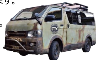
佐田工務店 初号機

また、全国各地を周るためにDIYでカスタマイズした移動車、「佐田工務店 初号機」も展示します。新車を味のある年代物の車に変える技術を、その目でご確認ください。